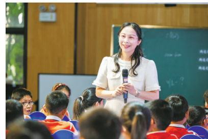
宁波市“三新”视域下小学数学新教材培训在海曙区古林镇中心小学开展。