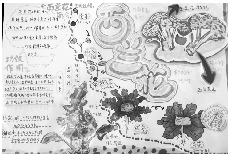
海曙区石碶街道冯家小学402班 陈若涵(证号J26003096) 指导老师:毛竹芬

夕阳西下,我依依不舍告别樱花公园。如诗如画的景致,在脑海中久久回荡,令人流连忘返。