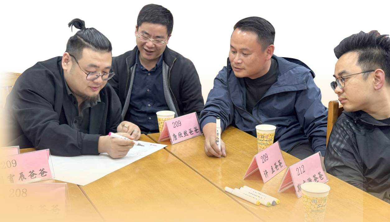
爸爸们分组讨论。

整合等途径办综合高中;通过挖潜扩容、新增建设、改造更新、资源整合等方式,重点增加公办普通高中招生计划。在2025年基础上,实现普通高中入学率再增两个百分点,满足人民群众“上好高中”的热切期盼。