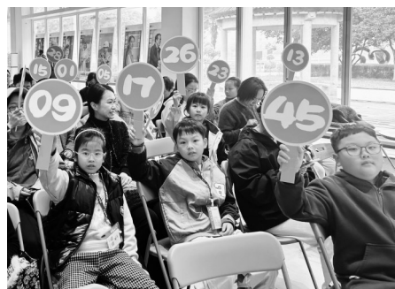
拍卖会现场,大家竞相举牌。

据了解,此次参加拍卖的拍品共有27件,其中18件选自甬城文明小使者团在爱心公园展出的作品,其他的则是孩子们现场捐赠的手工作品,共拍得爱心款项3982元,全部汇入宁波市慈善总会账户,用于慈善公益事业。