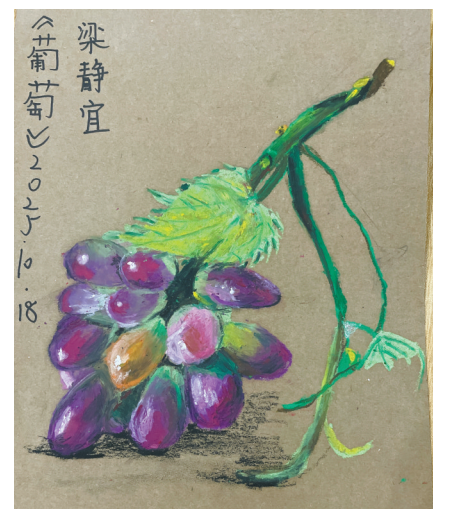
葡萄 高新区信懋小学 503班 梁静宜(证号 J26086954) 指导老师:沈晓萍