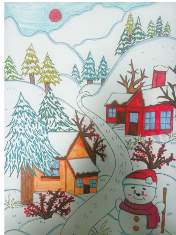
冬日雪景 余姚市第一实验小学花园校区 603班 杨若晗(证号 J26401977) 指导老师:余静