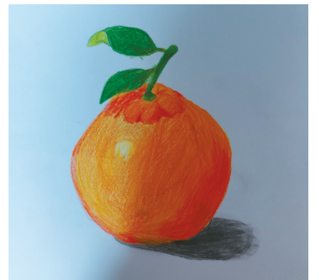
橘子 宁海县实验小学 504班 杨倩(证号 J26603935) 指导老师:郭孙婷