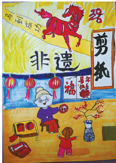
非遗剪纸 海曙区海曙中心小学 504班 胡菁宁(证号 J26008425) 指导老师:冯梦姣