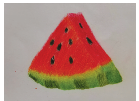
西瓜 宁海县城西小学 401班 章君沂(证号 J26601112) 指导老师:傅莹莹