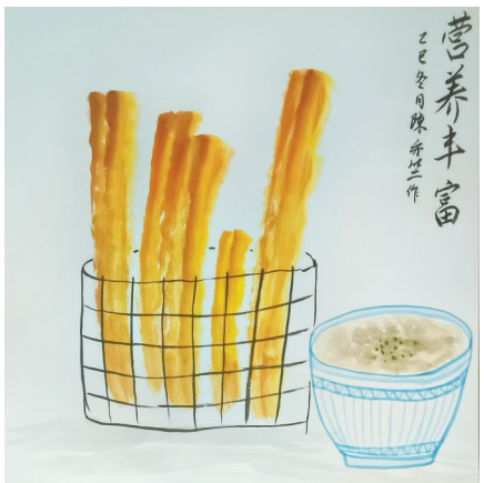
经典早餐 海曙区横街镇中心小学 603班 陈亦竺(证号 J26000874) 指导老师:胡迪