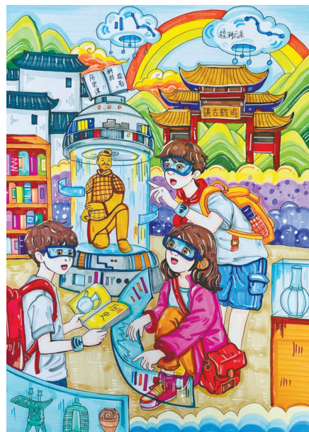
古韵新旅 慈溪市慈吉实验学校 609班 余祖霖(证号 J26880279) 指导老师:张群英