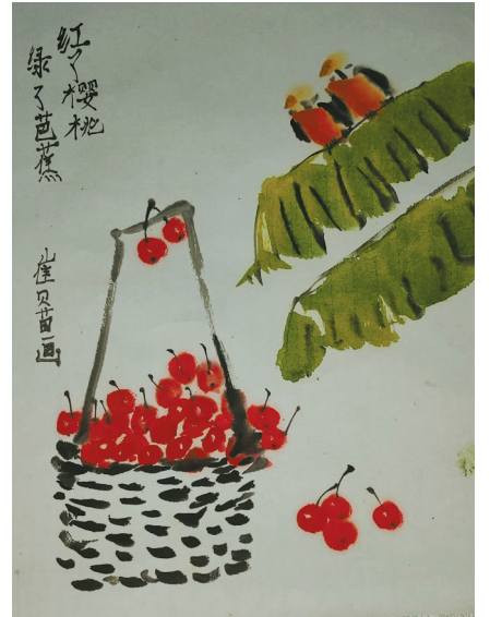
红了樱桃,绿了芭蕉 海曙区洞桥镇中心小学 504班 崔贝苗(证号 J26880062) 指导老师:徐鸣飞