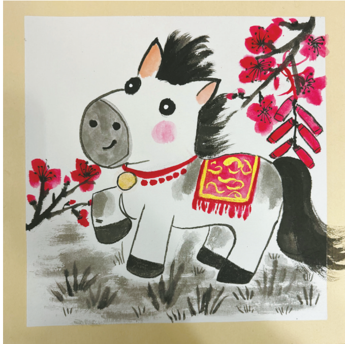
马踏福来 镇海区实验小学 410班 叶岚祯(证号 J26201720) 指导老师:童淑颖