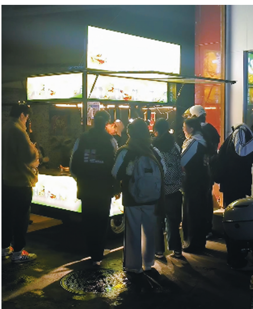
宁海中学学生捧场杨叔的夜宵摊。视频截图

本报讯(现代金报|甬派记者 钟婷婷 通讯员 卢建鹏)近日,在宁海中学的校门口,一个写着“我们是听障人士”的夜宵摊位,在一群高中生的“追捧”下,成了一股冬日里的暖流。