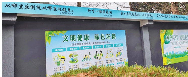
同学们的“一句话”,被印在校园里的多处墙体上。

经过遴选,一批优秀作品被精心制作,悬挂于教学楼前的墙体上,形成了一道独特而亮丽的“话语风景线”。