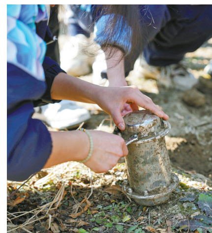
同学们挖出“时间胶囊”。

“有目标,才有方向;有计划,才有行动。”他说,“与其在结果出现后才去追问原因,不如从一开始就学会思考:我想成为谁?我该如何抵达?这不仅是一次心理课的延伸,更是一堂关于成长的人生课。”