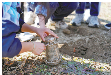
同学们打开一年前埋下的“时间胶囊”。