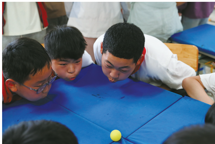
▲4月22日,鄞州区邱隘镇中心小学,学校因地制宜,课桌秒变“运动场”,同学们进行课间吹乒乓球比赛。