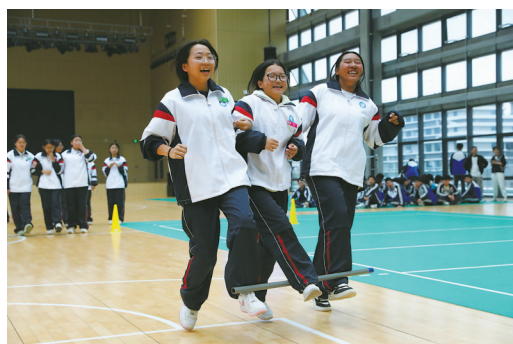
◀11月6日,因为下雨,象山港高级技工学校的同学们在体育馆里开展大课间活动。