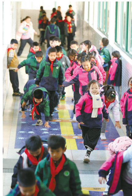
▲12月26日,宁波市四眼碶小学,同学们在走廊里进行课间体育运动。