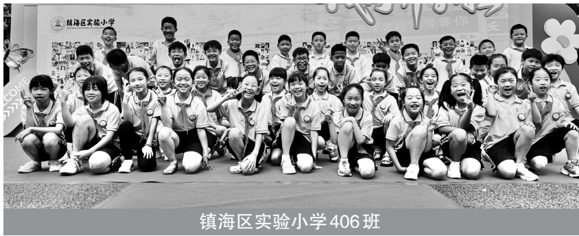
镇海区实验小学406班

在你们写下这些文字之前,游戏只是风一样跑过的快乐;当你们写下这些文字之后,游戏变成了可以反复打开的星光盒子——轻轻翻开,看见老鹰的翅膀扑棱在句子里,长绳甩出彩虹般的弧线,抢椅子时那瞬间屏住的呼吸,像小蘑菇一样从字缝间钻出来。原来,最珍贵的写作,就是为易逝的时光系上一个温柔的结,让那些奔跑的午后、撒欢儿的笑声,从此住在纸页里,随时等你们翻阅。 指导老师 王雪琼