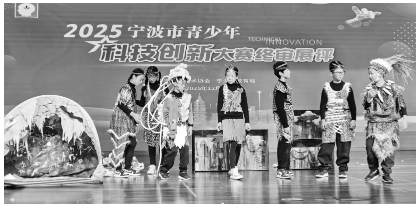
头脑创新思维赛比赛现场。

在该赛项中,命题的开放性给予了孩子们天马行空的想像空间。他们需要在有限时间内,综合运用科学、技术、工程、艺术等多学科知识,将抽象的创意转化为具体的解决方案,并进