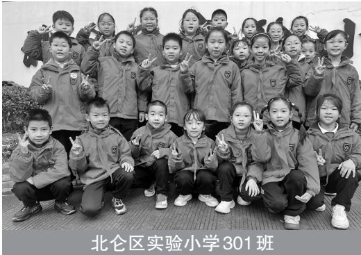
北仑区实验小学301班