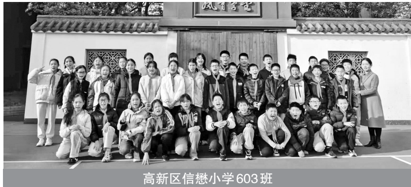
高新区信懋小学603班

听到他们的话，我的心里涌起一股暖流。夜渐渐深了，公园里的人慢慢散去，我依旧挺立在亭子旁，把光洒在道路上。虽然平凡，却十分自豪。