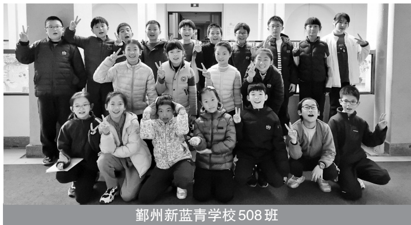
鄞州新蓝青学校508班