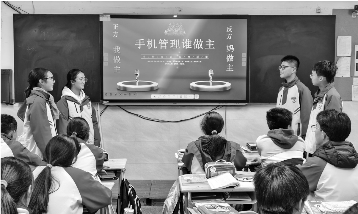
镇海区立人中学开展“手机管理谁做主”辩论赛。