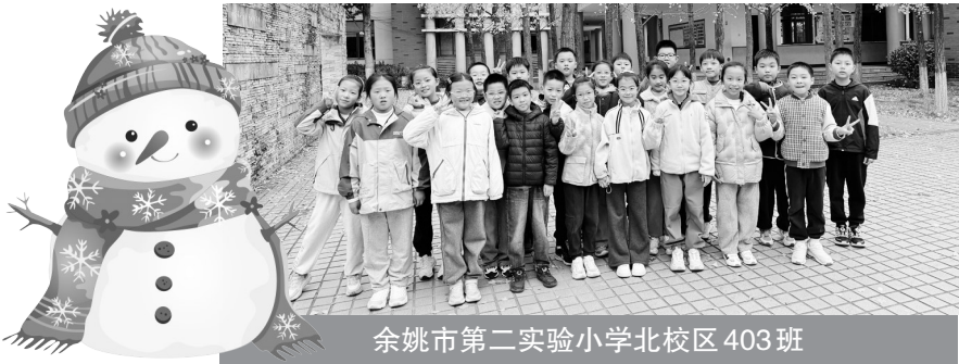
余姚市第二实验小学北校区 403 班