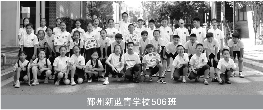
鄞州新蓝青学校 506 班