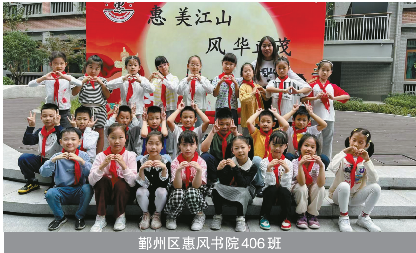
鄞州区惠风书院406班