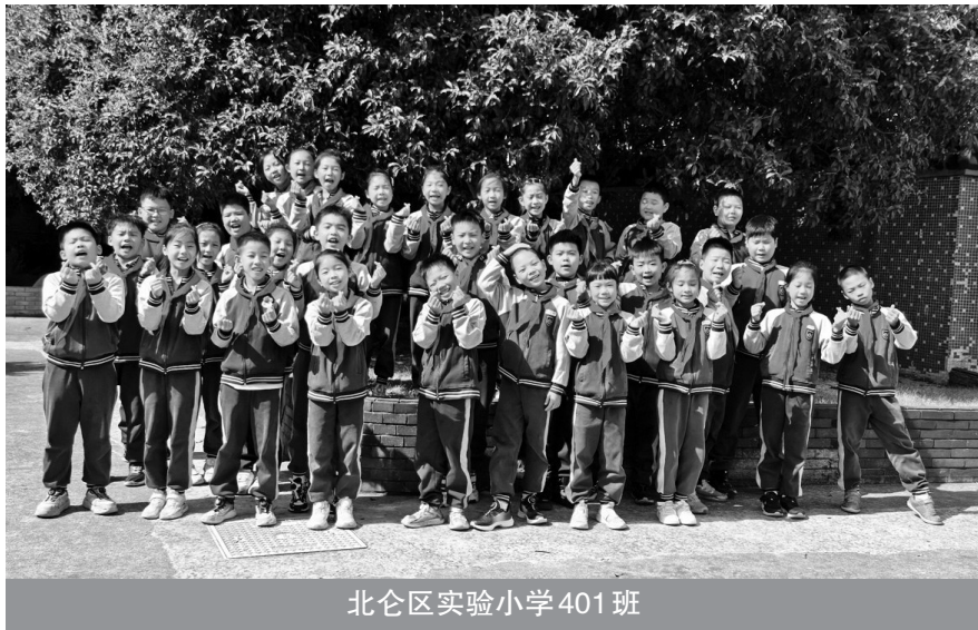
北仑区实验小学401班

▲《鲁滨逊漂流记》让我深切感受到坚韧与勇气的力量。鲁滨逊孤身一人流落荒岛,面对一无所有的境地,从未放弃过希望。他用自己的双手和智慧,在荒岛上顽强地生存下来。他的故事激励着我,无论身处何种逆境都不能轻言放弃,要勇敢地面对困难,积极想办法克服,做一个勇敢、坚强的人。