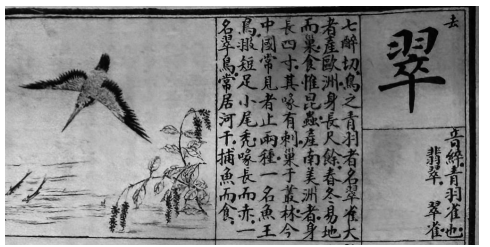
《澄衷蒙学堂字课图说》中对翠字的解释。

有人曾把《澄衷蒙学堂字课图说》与《现代汉语词典》进行比较,总体而言,《现代汉语词典》对字解释全面,但偏理性、偏抽象,而《澄衷蒙学堂字课图说》的释义详细明了,具有文化色彩,适合平日里阅读。