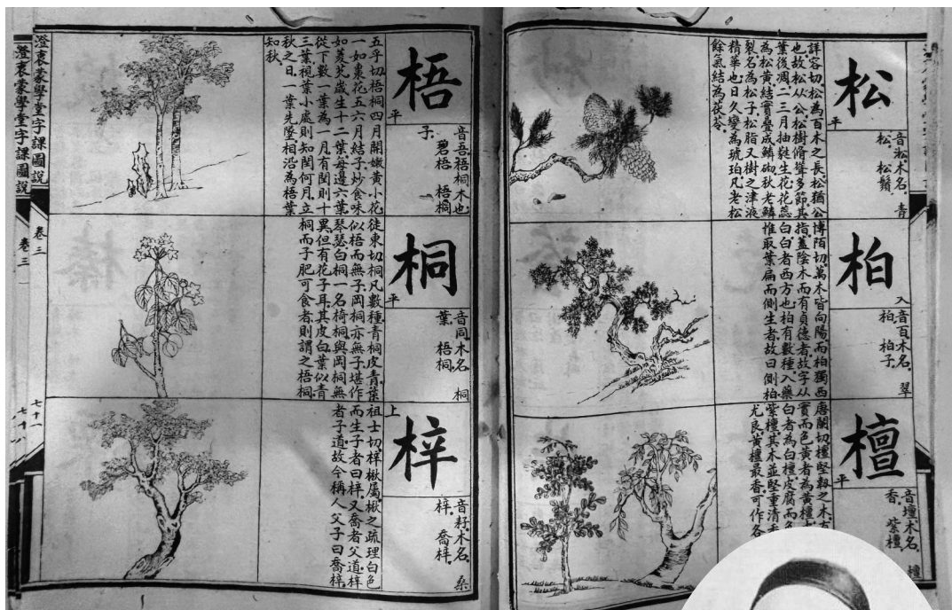
《澄衷蒙学堂字课图说》内页。