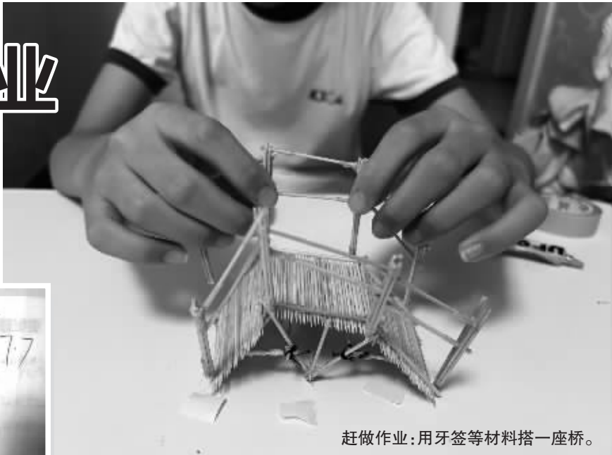
赶做作业：用牙签等材料搭一座桥。