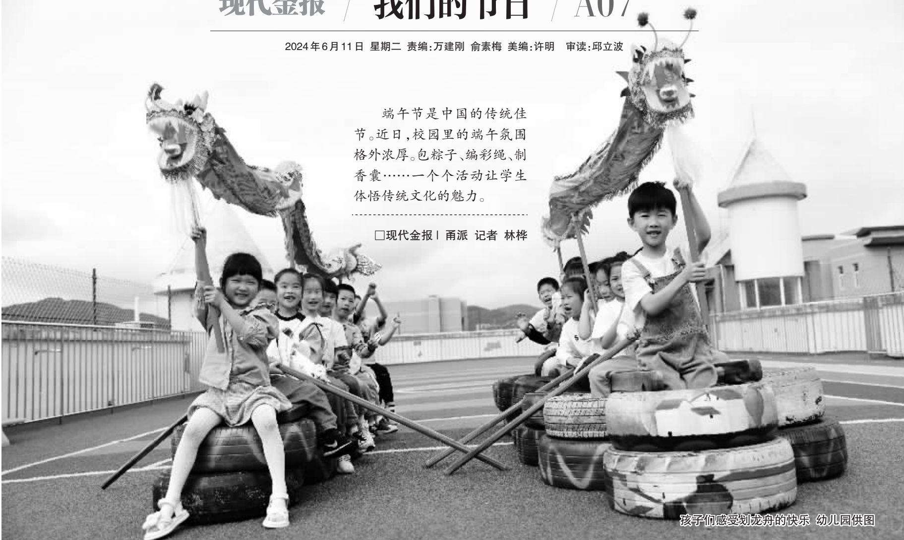
孩子们感受划龙舟的快乐