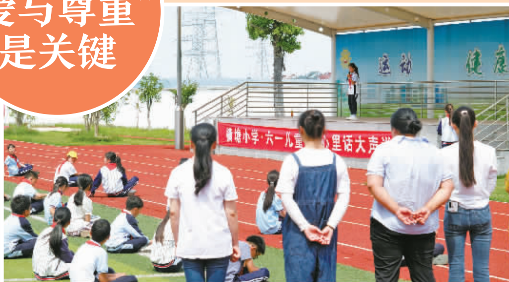
余姚市横塘小学,学生在台上向台下的家长和同学们“喊话”。