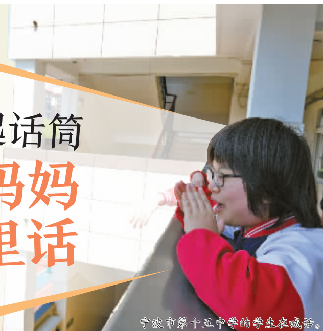
宁波市第十五中学的学生在喊话。