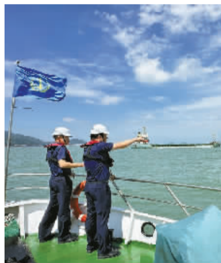
海事人员正在海上巡查。