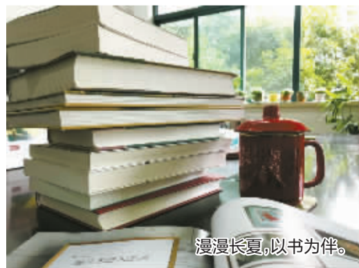
漫漫长夏,以书为伴。