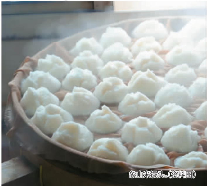
象山米馒头。(资料图)