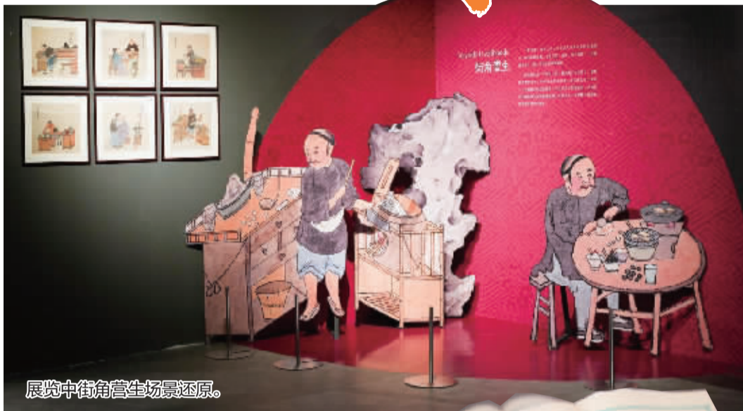
展览中街角营生场景还原。

该特展由宁波市文化广电旅游局(宁波市文物局)指导，宁波博物院、浙江万里学院(宁波市海丝文化研究中心)、德累斯顿国家艺术收藏馆(萨克森民族志收藏)三方合作主办，并得到浙江省博物馆、嘉兴博物馆、义乌市博物馆、宁波市文化馆的支持，将持续至11月1日。