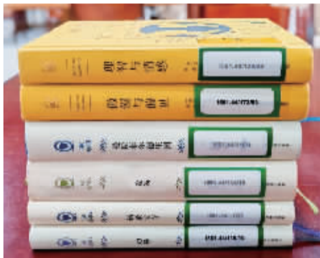
“小莲藕”借阅过的书。

她网名叫“小莲藕”，是社交平台上一位拥有5万多名粉丝的读物博主。在社交平台上，她坚持分享阅读与观影心得，文笔细腻风趣。而在现实生活中，她是宁波图书馆30多年的老读者。近日，在1001PAGES咖啡馆，记者见到了这位自带书卷气的“网红”姐姐，聊阅读、谈电影，过程轻松又愉快。