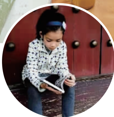
▲记录女儿阅读过程。