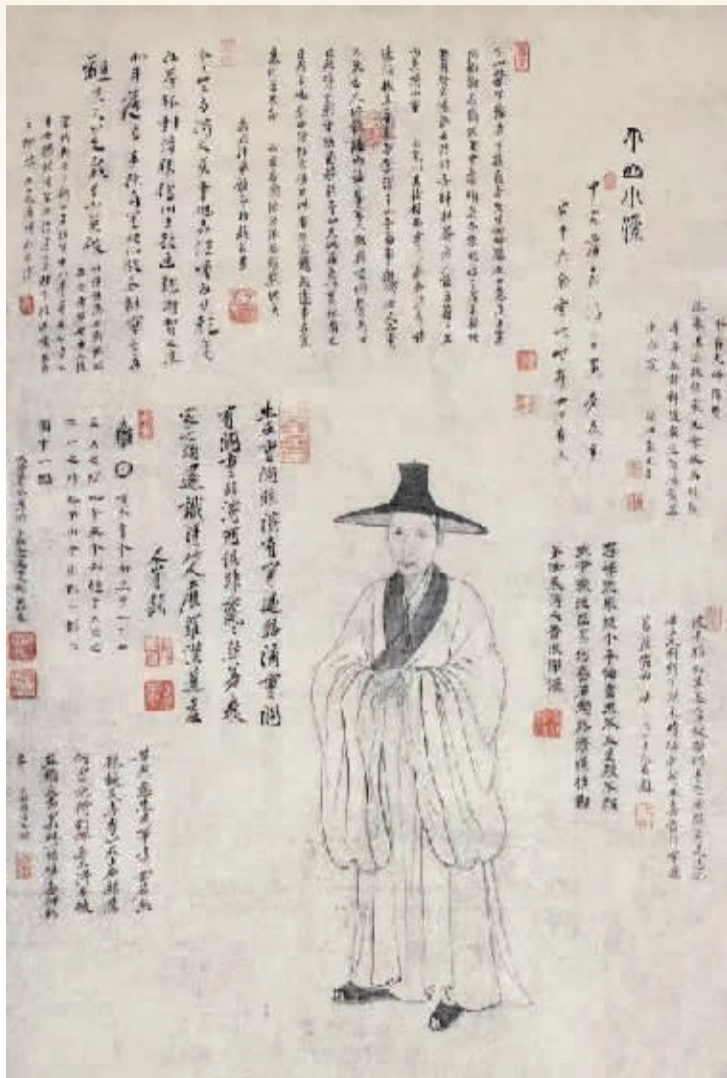
黄安平为八大山人画《个山小像》 南昌八大山人纪念馆藏