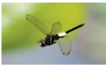
玉带蜻是宁波城区最常见的蜻蜓。