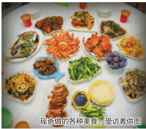
瑶瑶做的各种美食。

瑶瑶是一名高二住校生，一周回家一次。上周六清晨，刚洗漱完的她窝在沙发上，第一时间跟爸爸念叨想吃的菜：“爸，上次家门口小饭店的炒豆角味道太绝了，现在想想都馋。”