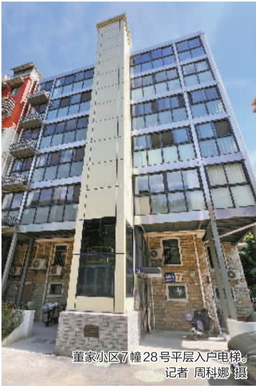
董家小区7幢28号平层入户电梯。

“这部电梯用了4个多月了，生活方便太多了！”站在7幢28号单元电梯口，居民吴师傅笑着和记者聊起变化。他告诉记者，以往采购整箱米面粮油、大件生活用品，只能先堆在楼下车棚，再一趟趟往楼上搬，来回折腾格外费力。“现在可不一样了，电梯‘叮’的一声就能直达家门口，拎再多东西也不用发愁，这电梯真是装到了我们心坎里。”