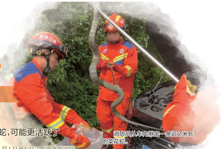
消防员从车内揪出一条近2米长的菜花蛇。

同样，市面上多数驱蛇产品也依赖气味干扰。如驱蛇粉，有些成分含有二硫化二砷（和雄黄的主要成分一样）。而蛇本身并不害怕这些物品，驱蛇的实际效果很难保证。