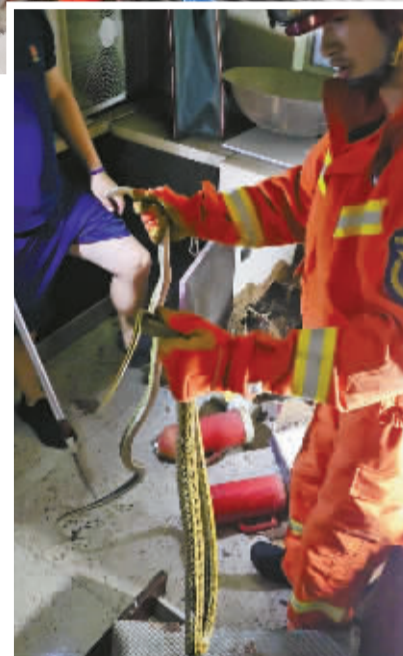
消防员从居民厨房里揪出两条菜花蛇。