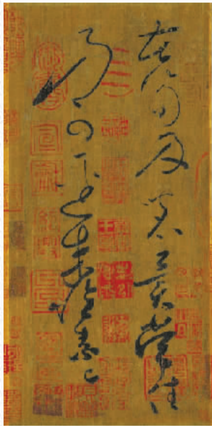
怀素《苦笋帖》，去年曾在上博东馆展出。