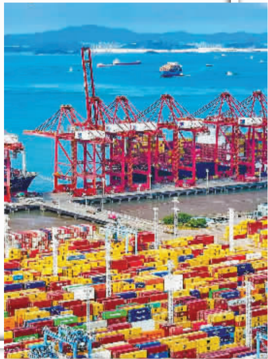
初夏的宁波舟山港穿山港区。