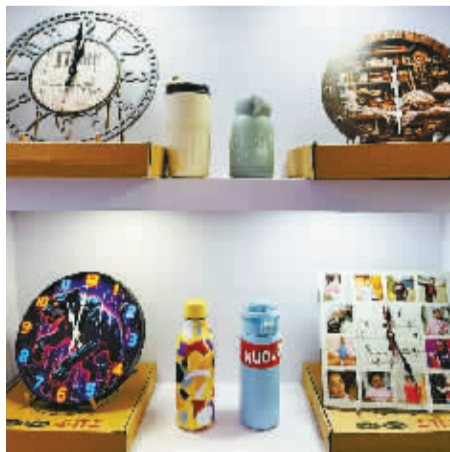
全球定制网展示的POD定制产品。

Logan介绍:“这次参加宁波跨博会,我们希望结识更多想尝试‘AI+POD’模式的跨境电商卖家和创业者,也希望把深圳的运营经验,复制到宁波这座制造业基础雄厚、外贸氛围浓烈的跨境电商大市。”