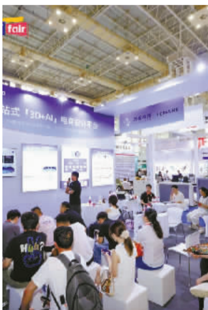
酷家乐棚拍展位现场。

在跨境电商行业,视觉营销的重要性不言而喻。产品的照片和视频能否快速抓住眼球,往往是决定流量和销量的关键。如今,这一环节正被AI技术重塑。