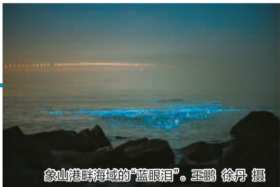
象山港畔海域的“蓝眼泪”。