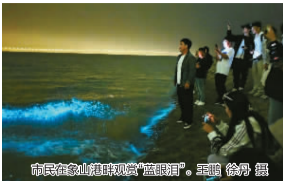
市民在象山港畔观赏“蓝眼泪”。