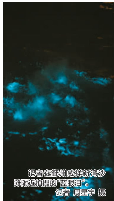
记者在鄞州咸祥新湾沙滩附近拍摄的“蓝眼泪”。

近日，宁波海域“蓝眼泪”进入集中爆发期。鄞州咸祥、象山青菜村等多地连续观测到这一罕见景观，其中咸祥象山港海域尤为壮观，吸引了大量市民连夜奔赴海边“追泪”。