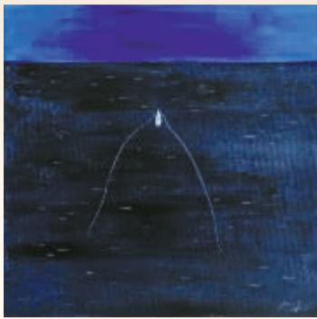
阎云泉 油画《海迹系列之远航》 34厘米×34厘米