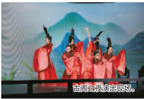
古阁之夜演出现场。

4月27日晚，状元厅池水倒映灯火，一场别开生面的文化雅集在此启幕。天一阁博物院品牌活动“天一阁·开卷”翻开新篇章——以馆藏多部珍贵《水经注》古籍为核心，特邀复旦大学中国历史地理研究所教授、博士生导师李晓杰领衔开讲，融合多元艺术展演，带领观众穿越千年，循着郦道元的笔墨，沉浸式感受这部奇书的地理智慧与文学风华。