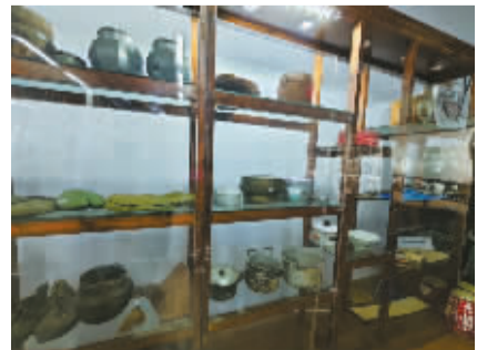
展厅内陈列着知青当年使用过的生活用品。