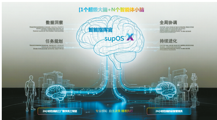
「大脑+小脑」架构示意图。

应用生成智能体实现工业应用开发突破,用户仅描述需求,即可在分钟级生成MES、APS等工业应用,将开发周期从月级压缩至分钟级。