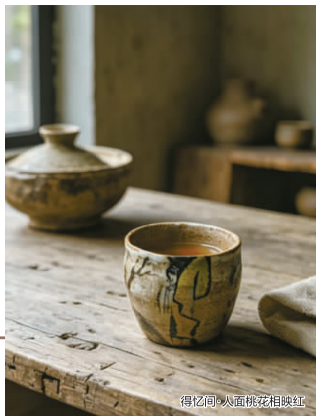
得忆间·人面桃花相映红

下次端起它，慢一点——看一看，握一握，用一用。也在这杯茶里，与那个素净的自己，悄然重逢。