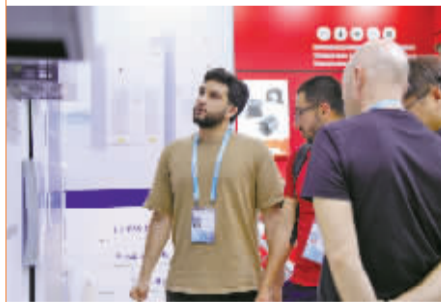
外商在东方日升展位了解光储设备。