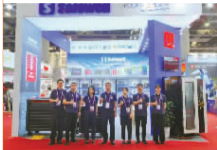
盛威国际展位。受访对象供图