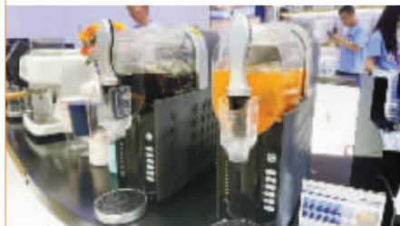
颢钻科技推出的雪融机。