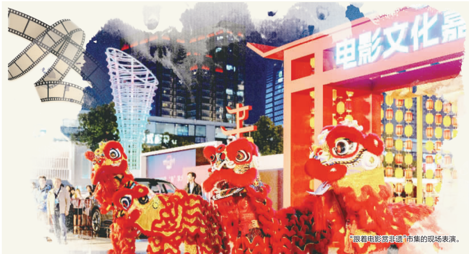
“跟着电影赏非遗”市集的现场表演。