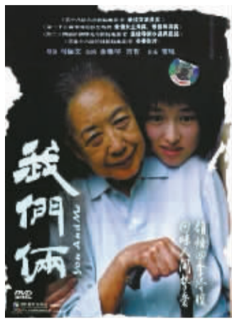
我们俩(2005) 导演:马俪文 | 时长:88 分钟

该片以裴艳玲的真实经历为蓝本创作,以戏曲演员秋芸的人生经历为线索,讲述了她自幼热爱戏曲、怀揣演绎钟馗的执念,因母亲私奔留下的阴影,被父亲禁止唱花旦,为坚守热爱改唱男角,成长中暗慕恩师却因世俗与现实错失,婚后成为母亲仍重返舞台重唱《钟馗嫁妹》,终获艺术成功,却始终被家庭牵绊、被情感苦楚困扰。在家庭期许与个人热爱中拉扯前行,在世俗眼光与情感纠葛中寻找自我。最终厘清内心、与家人和解,在戏曲热爱与亲情牵挂间寻得平衡。