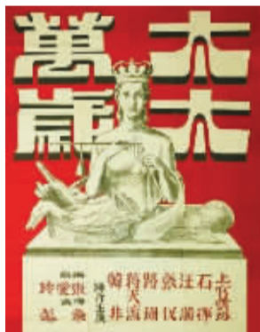
太太万岁(1947) 导演:桑弧 | 时长:107 分钟

这是当代普通人最真实的生活写照,紧扣家庭伦理的核心,道尽了年轻人与原生家庭之间的相处与和解。“脆皮青年”吴迪工作感情双双失意,沮丧返乡后,打破了家里原本的平静,那些藏在心底的隔阂,那些不善言辞的关心,在朝夕相处中被层层揭开。影片用细腻的镜头,捕捉了当代青年的焦虑与迷茫,也描绘了中国式家庭最典型的相处方式:爱藏在细节里,话留在心底里。吴迪的“走走停停”,是从逃避到面对,从隔阂到理解的过程,也是每个人与家庭、与自我相处的成长缩影。