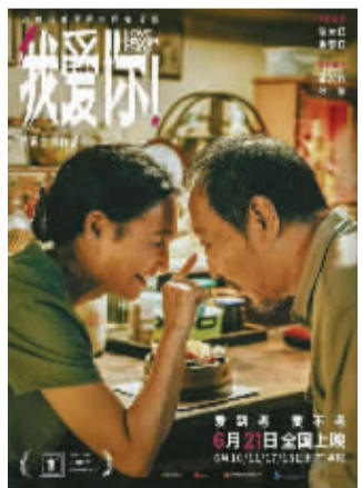
我爱你!(2023) 导演:韩延 | 时长:116 分钟

一个寒冷的冬天,来北京求学的年轻女孩小马,租下了独居在北京四合院里的孤寡老太太的房子,两人的故事就此展开。从最初因生活习惯不同产生的矛盾摩擦、互相较劲,到朝夕相处中逐渐敞开心扉,彼此成为对方生活里的温暖依靠。老太太的孤独被小马的青春活力打破,小马也在老太太的“刀子嘴豆腐心”中感受到别样的温情。而当小马毕业搬离后,老太太的精神世界瞬间崩塌,一段跨越年龄的女性情谊,道尽了孤独与陪伴的珍贵。