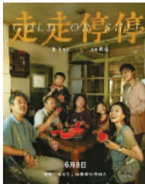
走走停停(2024) 导演:龙飞 | 时长:103 分钟

当生命走到终章,影片以最朴素的镜头语言,触达最厚重的情感。四位耄耋老人,两对迟暮爱人,在烟火气的市井生活里,用最朴素的方式诠释着人与人之间的相守。空巢老人与拾荒老太的不打不相识,患病夫妻相濡以沫的相互扶持,他们的相处,没有甜言蜜语的修饰,只有柴米油盐的陪伴,只有携手面对苦难的勇气。哪怕知道前路无多,也要大声说出爱意。