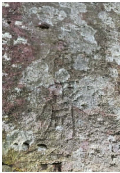
▲“履斋”二字落款。姜建清摄