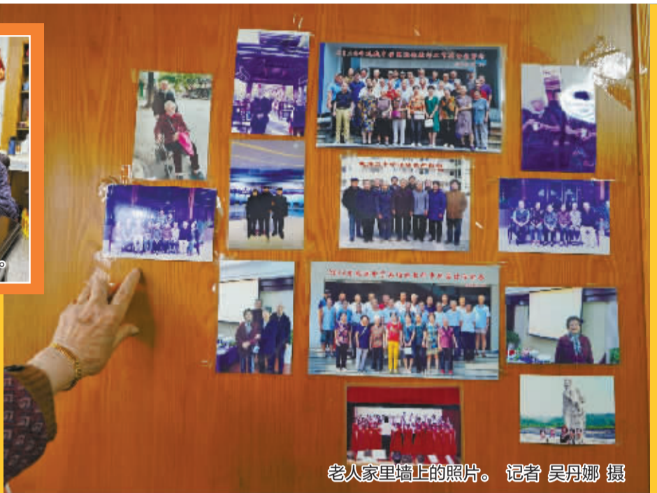
老人家墙上的照片。