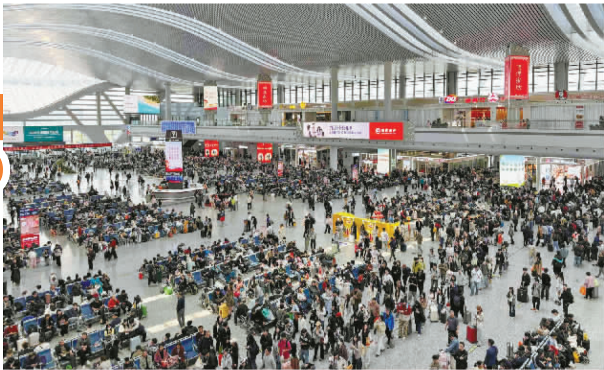
4月4日中午的铁路宁波站大厅。

在此期间，宁波的人口流动呈现什么特点？来宁波的都有谁，宁波本地居民又去了哪里？百度地图迁徙大数据给出答案。