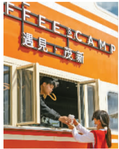
「遇见·茂新」网红火车咖啡

茂新村把航天科技搬进了乡野田间，打造了1:1等比例还原的模拟航天空间站，搭配太空农业体验中心，成为村里最具科技感的打卡点。站内完整还原了宇航员在太空的生活区域、实验区域，还配备了专属的学习体验设施，可以进行中小学生学习研学活动。