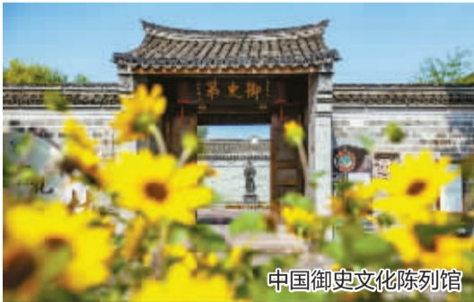
中国御史文化陈列馆