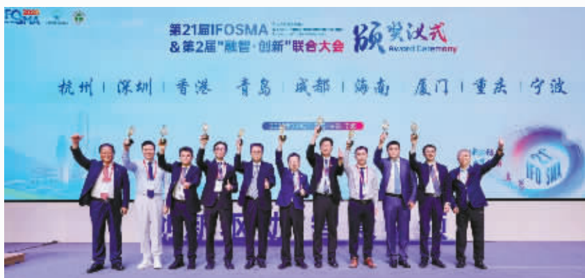
第21届IFSOMA&第二届“融智·创新”联合大会现场。

搭建国际舞台,彰显学科影响。医院成功举办第21届IFOSMA联合大会,促进全球专家智慧碰撞及深化协作,共同提升运动医学诊疗水平,为推动我国运动医学事业的高质量发展注入了强劲动力。“中国疗法”特色成果有力提升医院学术品牌影响力,让运动医学成果惠及更多患者。