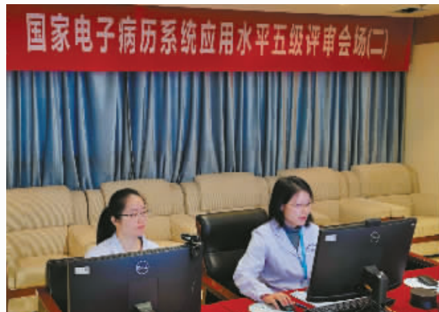
国家电子病历系统应用水平五级评审会现场。

智慧医院升级,AI赋能临床。医院依托全市首家通过国家电子病历应用水平和国家医疗健康信息互联互通标准化成熟度“双五”认证的信息化基础,建设AI应用矩阵,以智能技术驱动医疗服务模式革新,引领智慧医院建设,成为全市首家部署DeepSeek大模型的综合性医院。