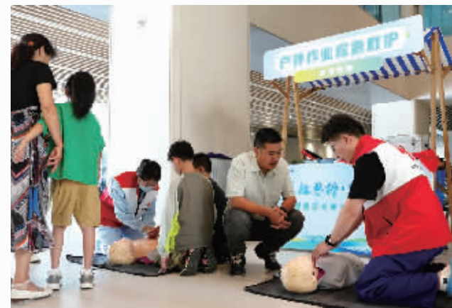
“医社惠侨·侨力共建”侨界志愿服务活动中开展急救培训。

践行社会责任,厚植为民情怀。医院紧跟人民群众医疗服务新需求,主动做到服务前移,积极延伸“仁心仁术 惠民利民”的服务半径。全市首家医疗机构“侨胞之家”创新“医疗+侨务”服务模式,全市首家“甬爱医院”为新就业群体筑牢健康防线,“健康传中国 医者在行动”主题活动展现科普实践单位的示范作用与实践成果,有力彰显医院公益本色与社会担当。