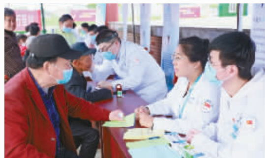
医院多个党支部在余姚泗门开展大型多学科义诊。

系统推动精神文明建设与“惠”文化实践,人文服务内涵持续深化,整体软实力实现新跃升,医院荣获文明城市创建集体二等功。