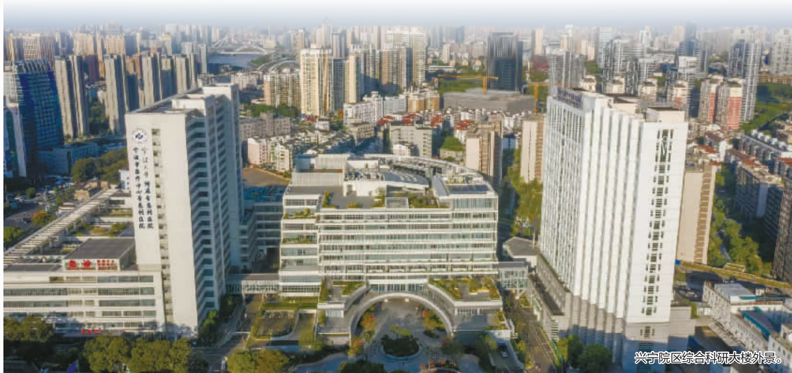
兴宁院区综合科研大楼外景。

平台能级跃升,打造转化高地。医院以高能级平台打造科创转化高地,建设科研创新平台和对外合作矩阵,加强与东南大学、大连化物所等大院大所合作,为区域医疗科创策源能力提升注入新动能。器官芯片与质谱代谢概念验证中心构建“研发—验证—转化”全链条服务体系,入选浙江省概念验证中心建设布局清单(全省唯一地市级医院)。