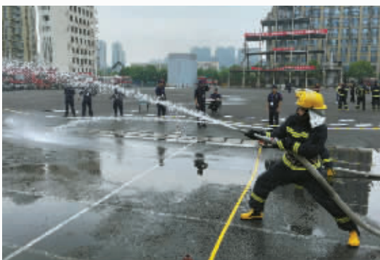
医院安保人员参加宁波市卫生健康系统第四届微型消防站技能竞赛。

智慧平安并进,筑牢安全基石。医院践行“安全发展”理念,以“人、车、物、环、管”为核心,构建数智化防控体系,以高水平安全保障助力全省共同富裕示范区建设,彰显医院治理的现代化水平,获评全国平安医院建设表现突出集体。