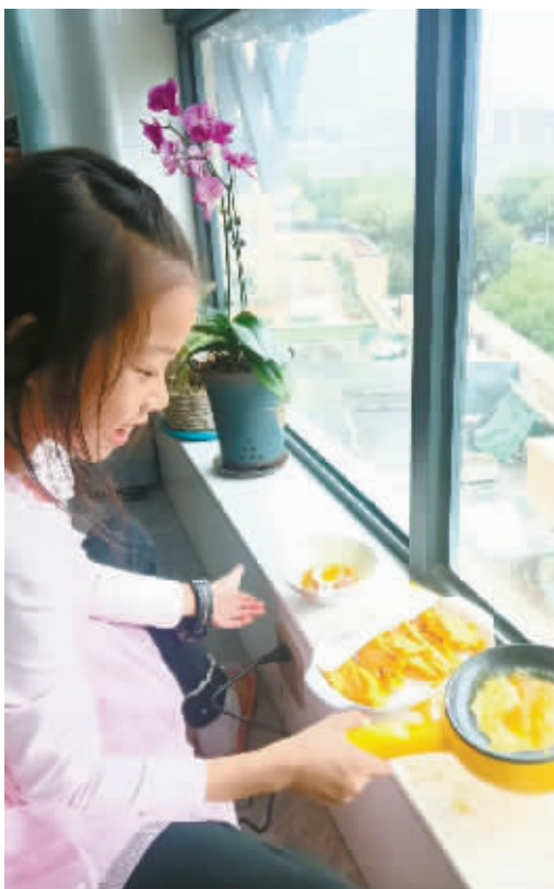
正在做蛋饺的韩同学。