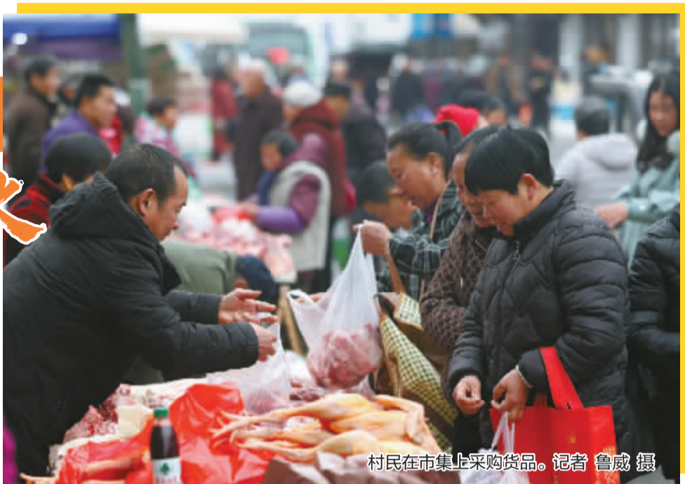
村民在市集上采购货品。

逢三逢七，赶一场山里的集；载着年味，赴一场百年之约。农历新年前夕，奉化区大堰镇的百年市集迎来了一年中最热闹的时刻。2月4日，记者凌晨4点就出发，走进这个藏在深山里的市集，感受这份如今已不多见的古市烟火。